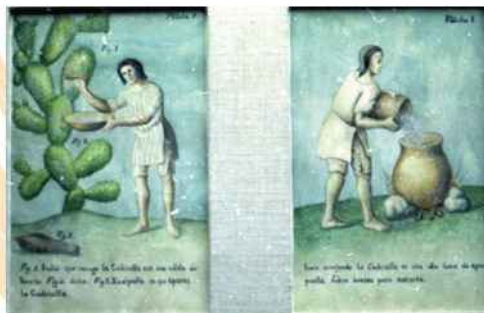
Tinte de cochinilla en América.

cambios en el arte de la tintura, imponiéndose por su calidad la cochinilla y el añil, fuente de excelentes rojos y azules respectivamente.