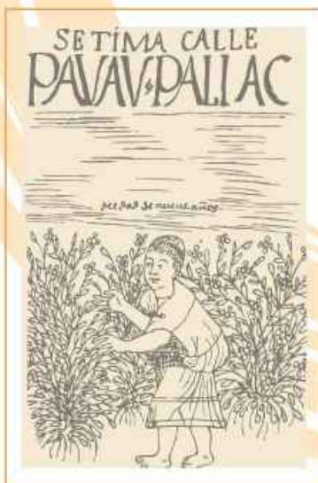
Dibujo de Guamán Poma de Ayala, donde un niño recolecta plantas tintóreas.

Este evento tuvo el auspicio del Ministerio de Planificación del Desarrollo, Viceministerio de Ciencias y Tecnología, del Ministerio de Culturas, y del Programa Art Gold de PNUD Bolivia e IDEASS, y se realizó con el apoyo de Red OEPAIC, de la Fundación Jalsuri para la Artesanía, Universidad Mayor de San Simón, Agruco, AECID y Cooperazione Italiana allo Sviluppo.