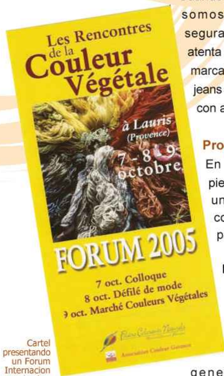
Cartel presentando un Forum Internacional al sobre tintes naturales.