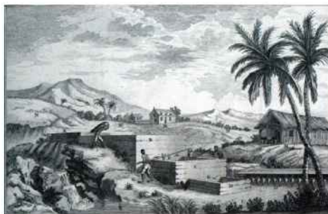
Un obraje tintorero.

La importancia de estos recursos naturales puso en juego poderosos intereses económicos y la explotación de los tintes tiñó episodios de la