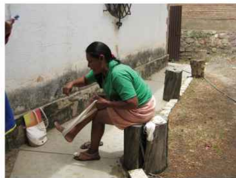
Participante en el taller del Encuentro, elaborando la madeja de algodón.

en Latinoamérica ha contribuido a mejorar en muchos casos su economía doméstica. Por otra parte, el cultivo de plantas tintóreas es una experiencia económica que ya está dando buen resultado en comunidades agrícolas de diferentes países.