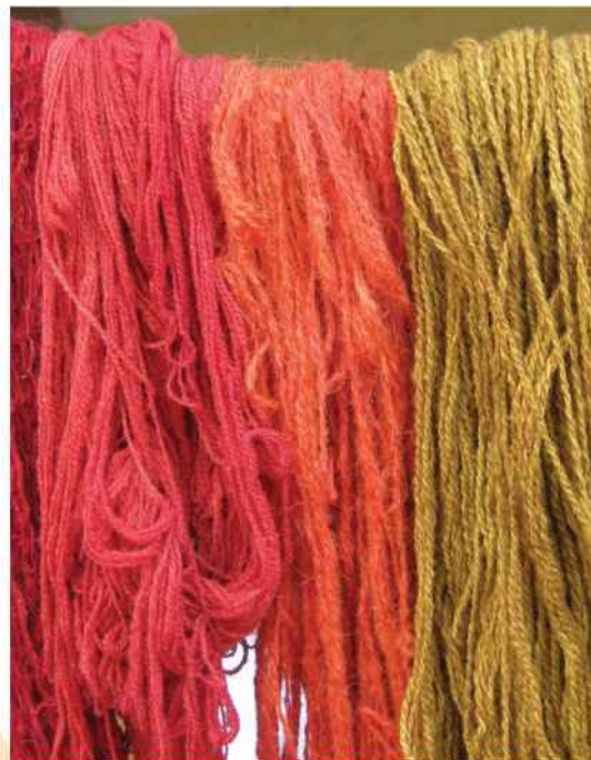
Colores obtenidos en lana, durante el taller del Encuentro.

Una vez conocidas las materias tintóreas disponibles en el área del proyecto, se realizará una colección de patrones de color que conforma la paleta que podrán manejar los tintoreros locales. Esta colección de patrones irá acompañada de los datos correspondientes al procedimiento de utilización y los productos auxiliares necesarios para fijar cada tinte.