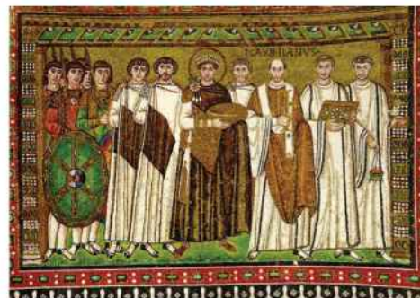
Túnicas medievales teñidas con púrpura.

Las fibras de algodón y camélidos fueron soporte del alarde de técnicas en la región andina. Colores y diseños eran una forma de lenguaje