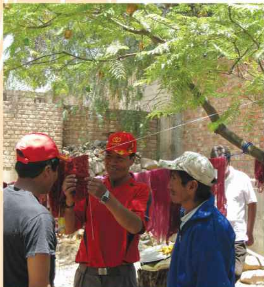
Participantes en el taller del Encuentro, intercambiando experiencias.

productores locales y las instancias de asistencia técnica internacional.