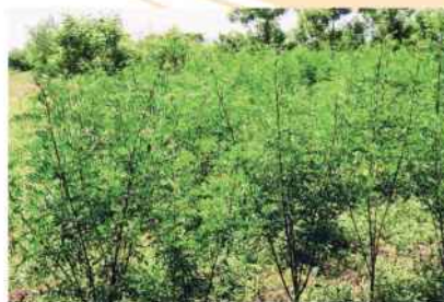
Plantación de añil.

En América, El Salvador retomó la actividad que lo hizo famoso en la época colonial y hoy es el mayor productor. También hay cultivos exitosos en México y Brasil.