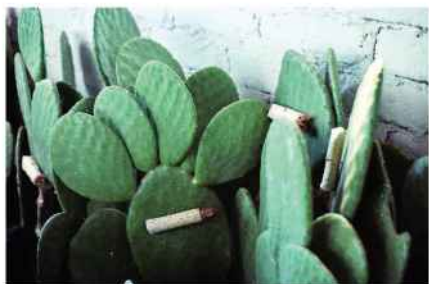
Penca de la tuna para el cultivo de cochinilla.

El proceso comienza con la reproducción de la Opuntia ficus-indica , cactus donde realizará su ciclo biológico la cochinilla y culmina con la recolección de las hembras maduras, su secado y clasificación de calidades.