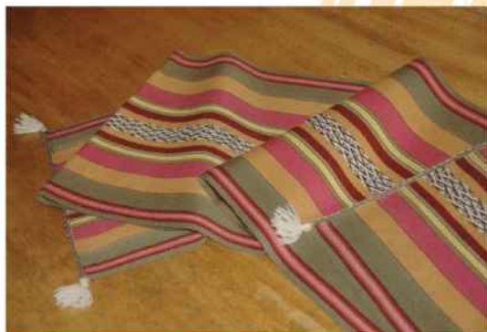
Pieza tejida en técnica de telar prehispánico, todos los tonos teñidos con plantas. Zona de Cochabamba, Bolivia.

con espontaneidad e imaginación, se dirige al mercado turístico, y otra parte, más reducida, de extraordinaria calidad y elevado precio, la adquieren coleccionistas particulares, instituciones y museos etnográficos. En el primer caso, el artesano vende con mayor facilidad una prenda si está teñida con tintes naturales, en el segundo caso, el cliente exige que se hayan utilizado tintes de tradición histórica.