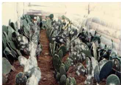
Cultivos de cochinilla.

La cantidad de cosechas anuales dependen de las condiciones de cada región. Los diversos aspectos relacionados con este tinte son objeto de encuentros multidisciplinarios anuales en México. En lo cotidiano, cada vez que