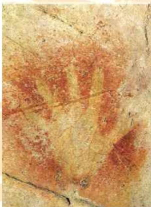
Pintura rupestre con color rojo de hematita.

La historia de los colorantes naturales es tan antigua como la humanidad: nuestros más lejanos antepasados se sirvieron de ellos dejando huellas de su paso en las cuevas y aleros donde se guarecían de la intemperie.