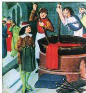
Tintoreros en el renacimiento.

La actividad de los tintoreros quedó representada en cuadros, sus imágenes persisten en vitrales de catedrales y su oficio en los nombres de calles europeas. Ellos eran el eslabón