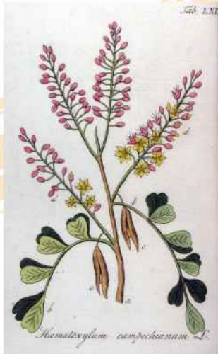
Planta de palo campeche usada para el teñido de tonos de rojo.

Los portugueses tomaron posesión de territorios sudamericanos donde crecía un árbol que ellos conocían de oriente y proporcionaba el color "brasil" (rojo). La historia registra disputas entre los reinos de España y Portugal, luego luchas emancipadoras, pero el tinte sigue presente en el nombre de nuestra nación vecina: la tierra del Palo Brasil.