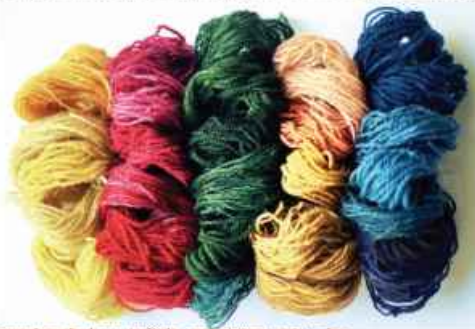
Ejemplos de lana teñida con tintes naturales llevada al taller del Encuentro.

Paralelamente ha surgido el interés por los productos orgánicos, desarrollados sin el uso de agroquímicos y respetuosos del ecosistema,