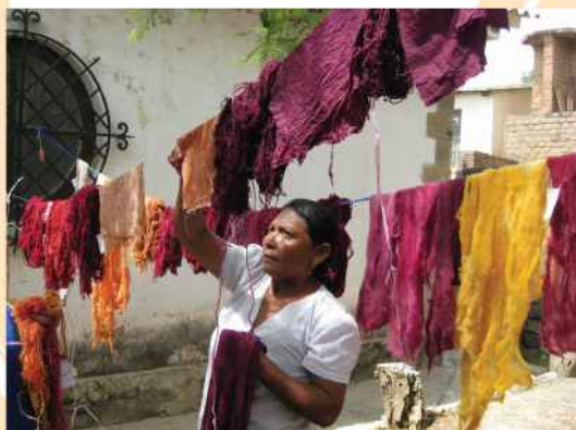
Participante en el taller del Encuentro.

seleccionadas y el contacto con agricultores interesados en el proyecto.